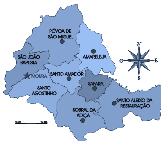
Mapa 2: Distribuição das freguesias do Moura